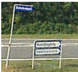
Figur 2, servicevejvisning i krydset Vardevej/Dalstrøget.

Det er Vejdirektoratets vurdering, at servicevejvisningen henviser til Janus Bygningen.