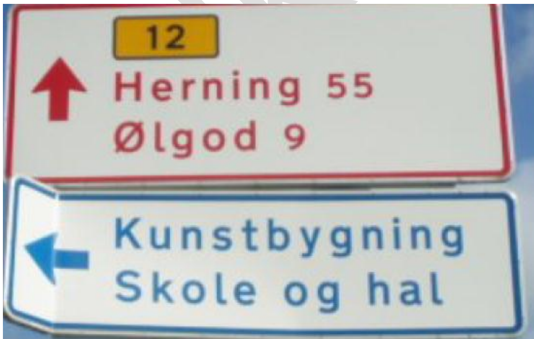
Figur 1, påkørt tavle

Den 1. januar 2018 er der kommet nye regler for servicevejvisning. Der skal derfor foretages en tilpasning af de 3 eksisterende servicevejvisninger i forhold til de nye regler. Det bemærkes, at der tillige står en tavle med samme nedenstående tekst fra modsatte retning i km. 53,0918.